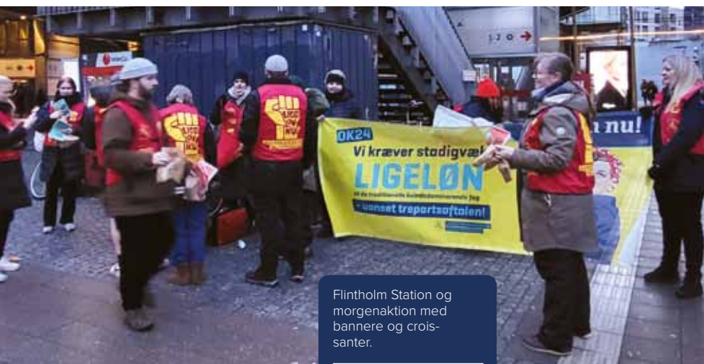
Flintholm Station og morgenaktion med bannere og crois-santer.

Den samlede pose penge, der har været at forhandle om til overenskomstforhandlingerne, er for lille. Derfor står et enigt forretningsudvalg i LFS bag en anbefaling af et nej til overenskomstaftalen, når den bliver sendt til urafstemning blandt medlemmerne.